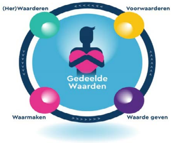
Figuur 1: De waardencirkel

De waardencirkel was nog erg vanuit beleid ingestoken, moet ik eerlijk zeggen, maar wel met de intentie om het verhaal van inwoners een plekje te geven in de beleidsprocessen en stappen die we maakten.