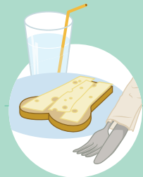
eten en drinken