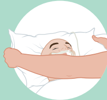
kussen goed leggen