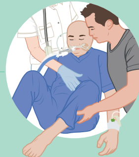
uit bed halen