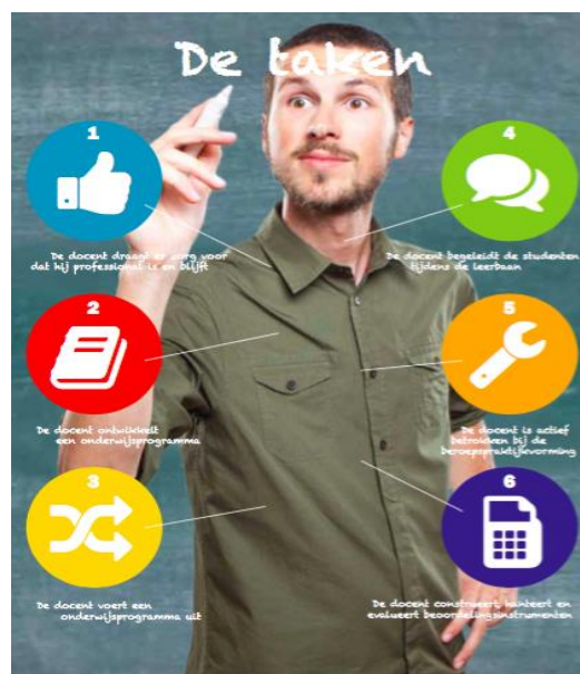
Figuur 2: Kwalificatiedossier mbo-docent