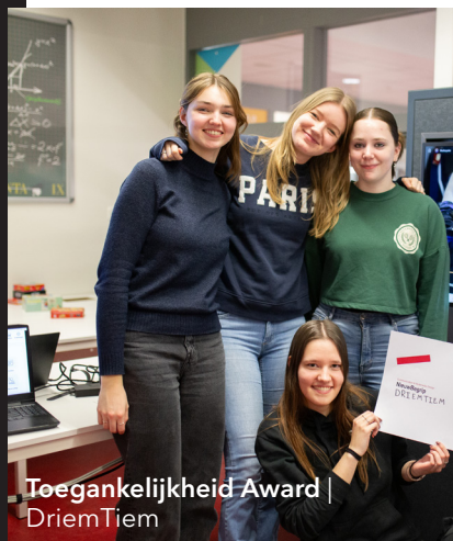
Toegankelijkheid Award DriemTiem

Ze hebben de doelgroep geen moment uit het oog verloren. En dat is ook de jury niet onopgemerkt gebleven. Met lovende woorden als "goed uitgewerkt" en "overal was aan gedacht" mochten ze uiteindelijk aan het einde van de dag de twee prijzen in ontvangst nemen!