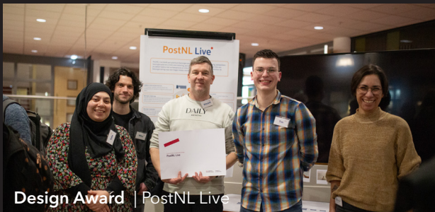
Design Award | PostNL Live

Of het een verrassing was dat ze een award mee naar huis mochten nemen? Sowieso! Zelf zien ze het vooral als een mooie afsluiting van het project. Trots zijn ze zeker: "We hebben laten zien dat je ook als deeltijdstudent echt tot iets in staat bent! We hebben, naast onze drukke banen, toch ruimte gevonden om samen te gaan voor het beste resultaat. Dat dit wordt beloond met een Design Award is wel heel erg mooi!", sluiten ze af.